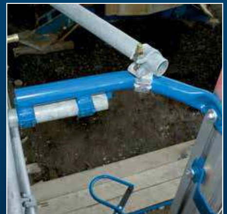
Verankerung am Gerüst