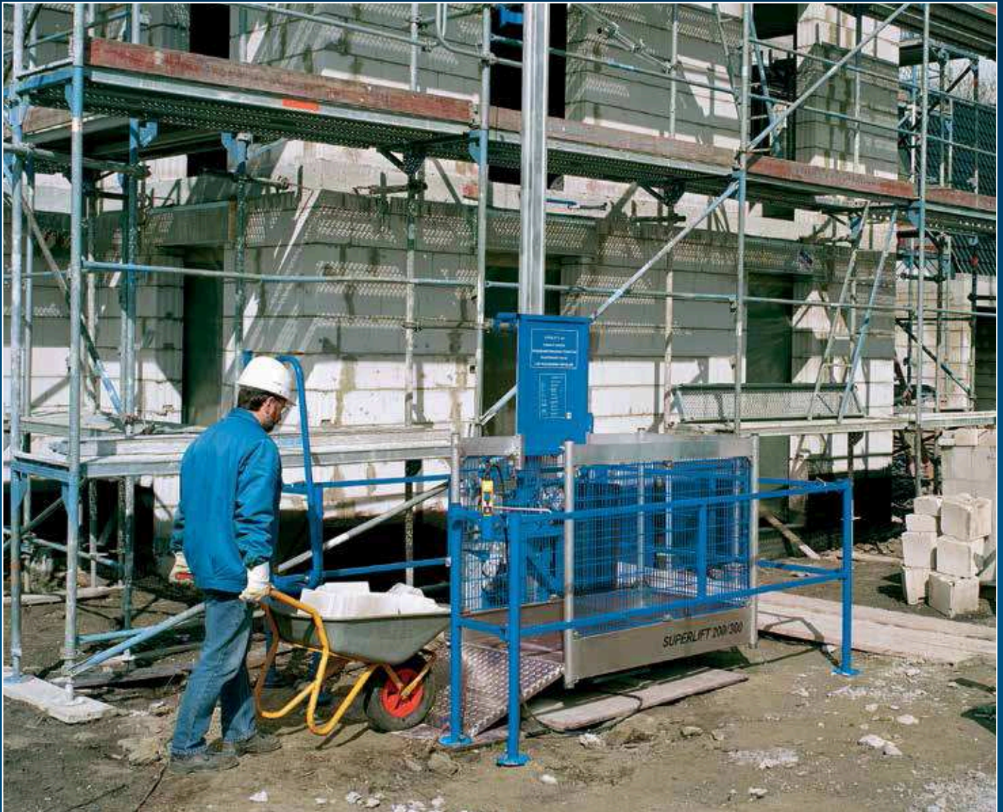
Große Lastbühne des Superlift Z 320 / Z 330 gewährleistet eine einfache Beladung